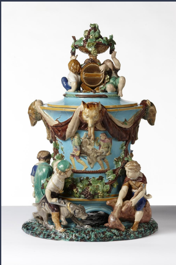
Manufacture Minton, Stoke-On-Trent, Royaume-Uni, Rafrâchissoir à vin, 1851