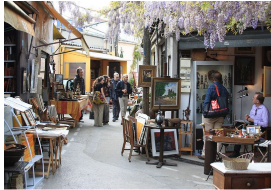
Les Puces de Saint-Ouen Marché Paul Bert