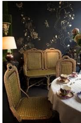
La Galerie Rue de Beaune, Paris